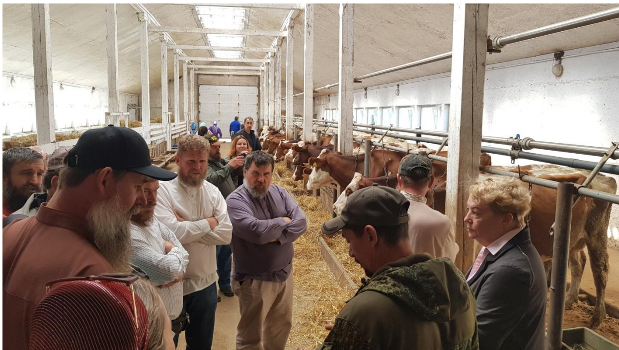
Встреча со старообрядцами из с. Биракан Еврейской автономной области